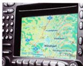
Porsche Communication Management (PCM)