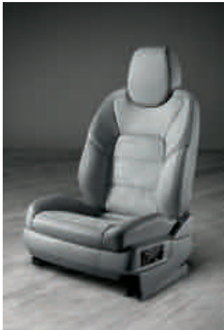
Siège sport avec Pack Mémoire Confort