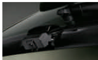
Caméra de recul