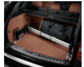
Pack aménagement du coffre