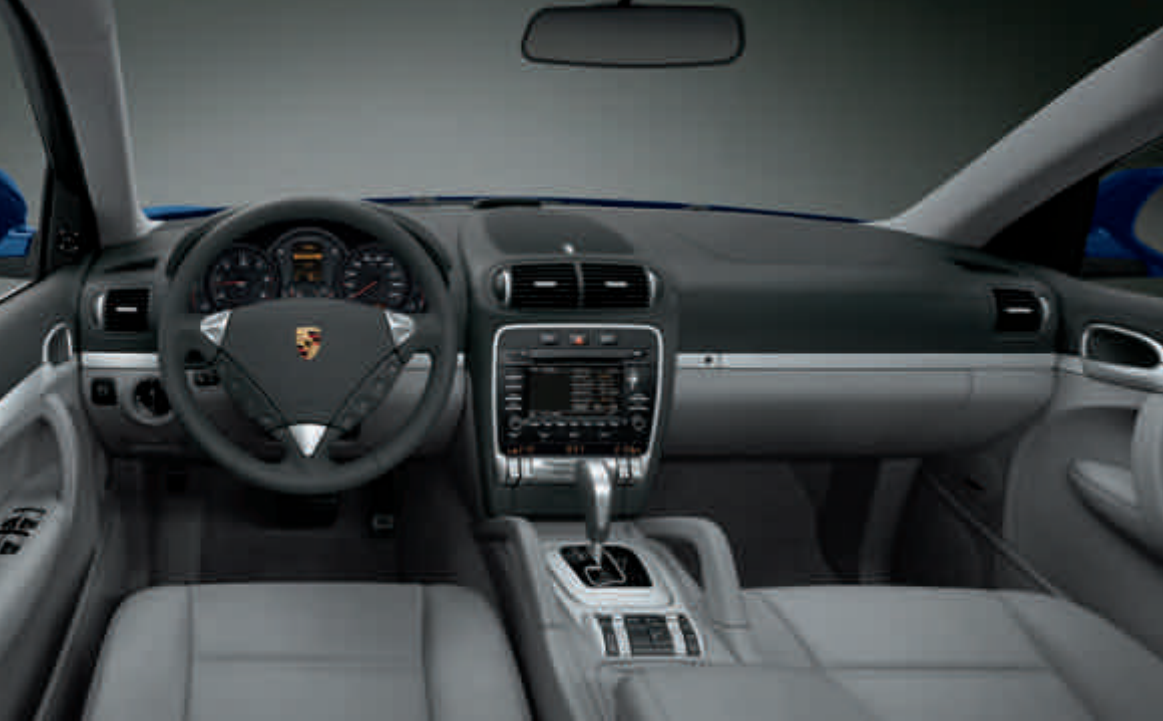
Cockpit du nouveau Cayenne Diesel doté du Pack Aluminium « Sport »