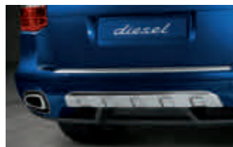
Cartier de protection arrière en acier spécial

Vous trouverez des informations détaillées sur l'ensemble des équipements disponibles pour le Cayenne Diesel dans les tarifs Cayenne Diesel, ainsi que dans le catalogue Cayenne ou encore auprès du Réseau Officiel Porsche. Les autres options de personnalisation ainsi que les accessoires sont présentés dans les catalogues Exclusive Cayenne et Tequipment Cayenne.