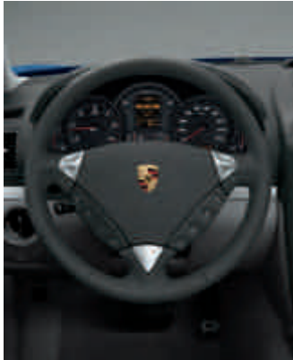
Volant multifonction à 3 branches avec commandes Tiptronic S au volant