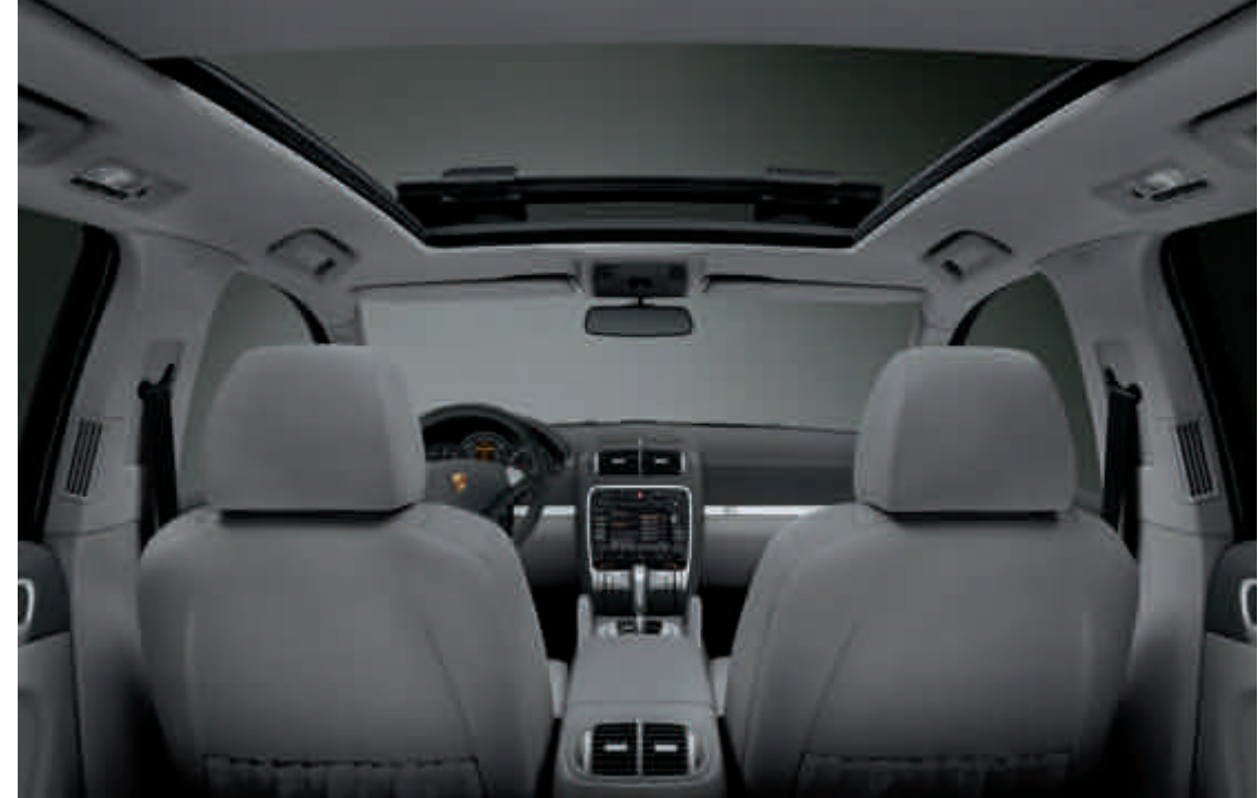
Système de toit panoramique