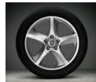
Jantes « Cayenne SportTechno » 20 pouces