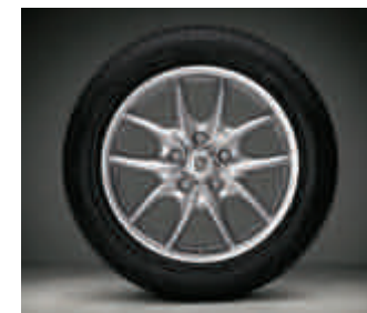
Jantes « Cayenne Design » 19 pouces