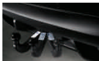
Dispositif d'attelage rétractable électriquement