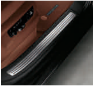
Pack Mémoire Confort avec baguettes de seuil de porte en acier spécial