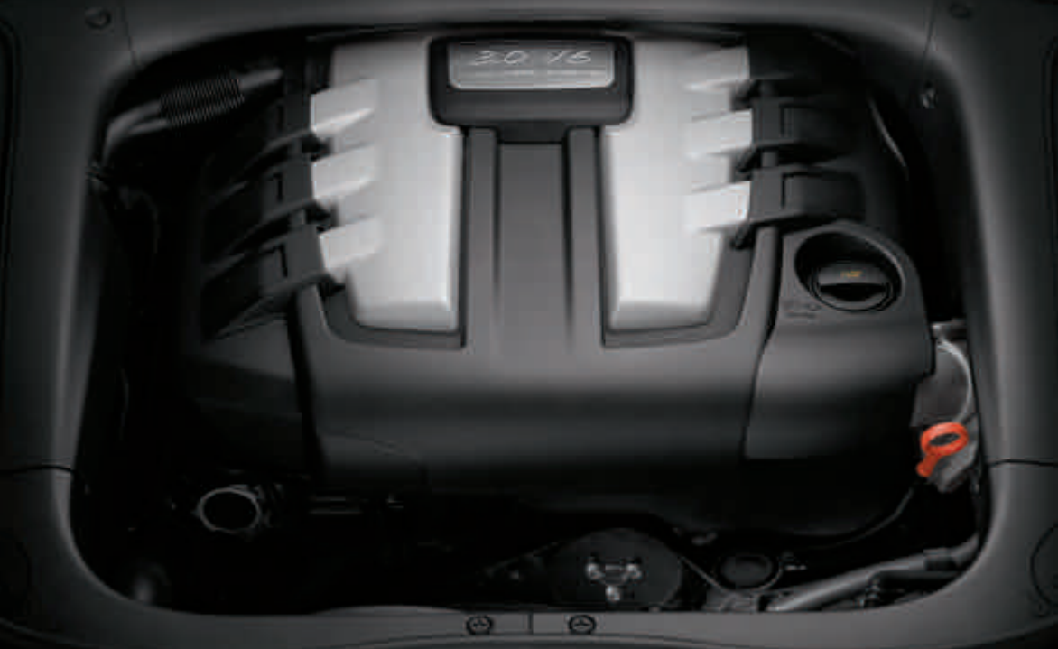
Le moteur V6 turbo diesel de 3,0 litres

Le système refroidi de recyclage des gaz d'échappement du moteur V6 turbo diesel de 3,0 litres de cylindrée renvoie une partie des gaz d'échappement vers le moteur. Résultat : une baisse de la température de combustion et une réduction des émissions d'oxydes d'azote. La présence du catalyseur à oxydation est une évidence, tout comme celle du filtre à particules. Et comme une évidence ne vient jamais seule : le nouveau Cayenne Diesel satisfait aux exigences de la