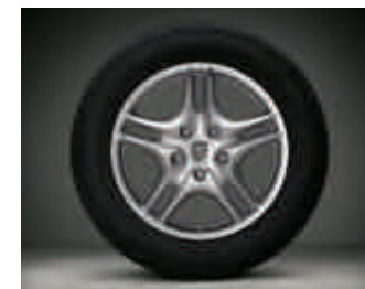
Jantes « Cayenne Turbo II » 18 pouces

○ Option • Équipement de série G Option gratuite Pour les explications des notes de bas de page, reportez-vous à la page 23.