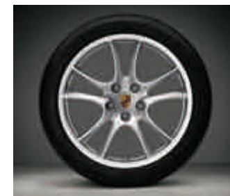
Jantes « Cayenne Sport » 21 pouces