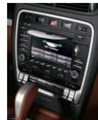
Porsche Communication Management (PCM) avec chargeur 6 CD/DVD