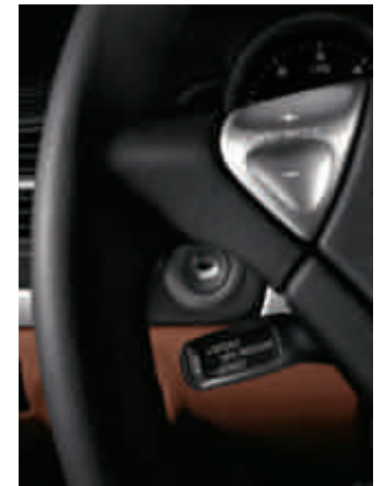
Régulateur de vitesse Tempostat