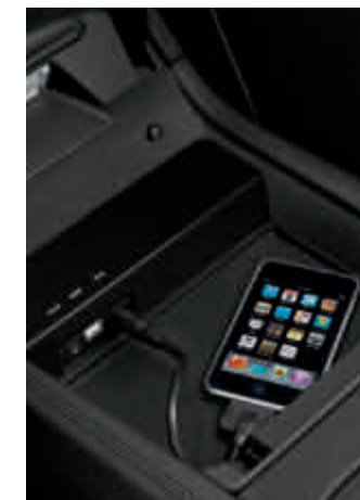
Interface audio universelle (iPod®, USB, AUX)

○ Option • Équipement de série G Option gratuite