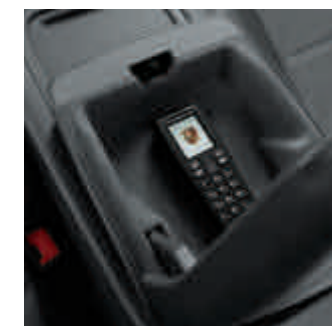
Module de téléphone avec combiné sans fil