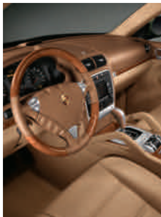
Pack bois Olive, clair