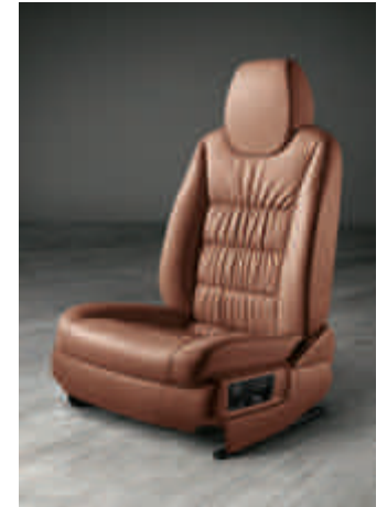
Sièges en cuir souple