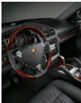
Pack bois Ronce de Noyer, foncé (finition brillante)