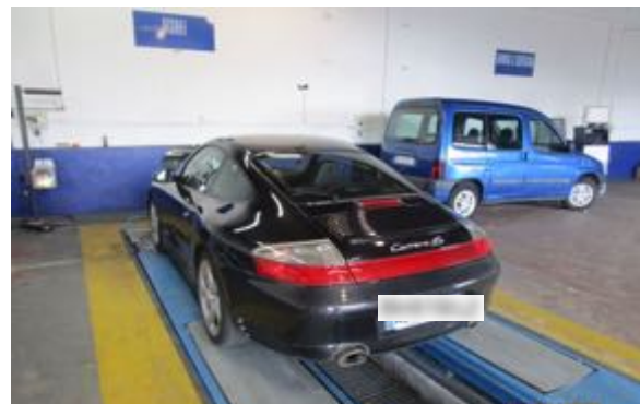
Flanc arrière droit et flanc arrière gauche