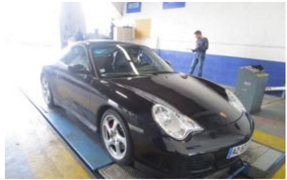
Flanc avant gauche et flanc avant droit