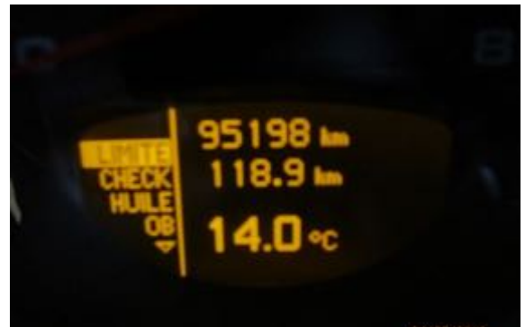
Intérieur du véhicule et compteur kilométrique