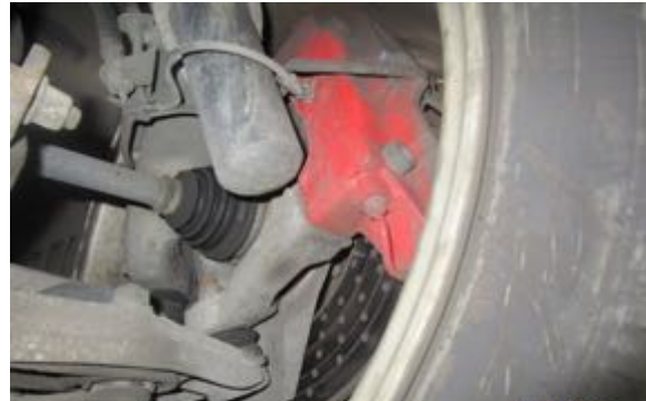
Demi-trains arrière gauche et droit