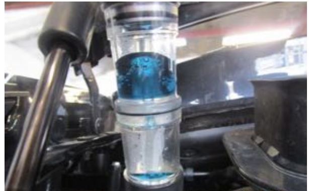
Test de CO2 dans le liquide de refroidissement