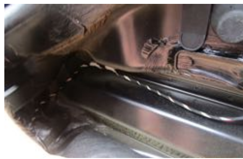
Absence de trace de réparation sur longerons avant gauche et droit