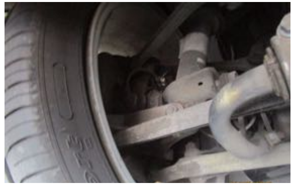
Demi-trains avant gauche et droit