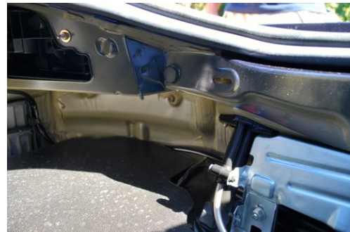
Absence de trace de réparation sur longerons arrières gauche et droit