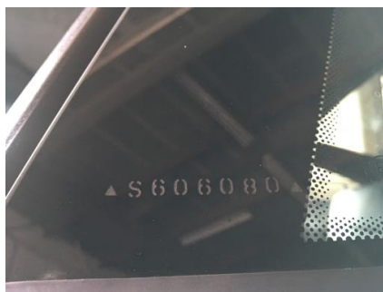
Gravage des vitres