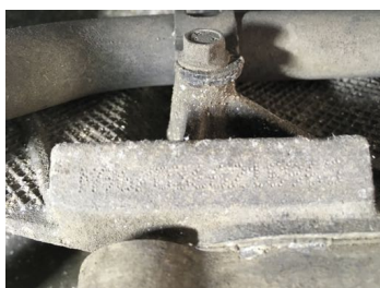
Frappe à froid numéro de moteur