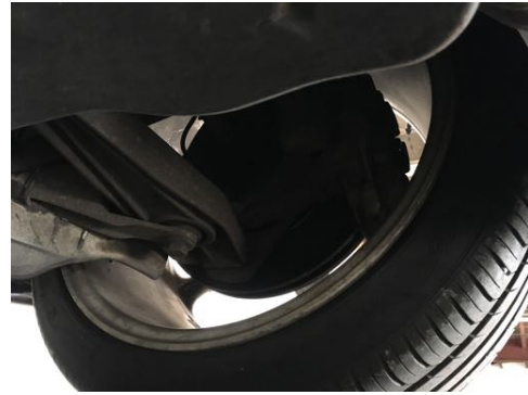
Demi-trains avant gauche et droit