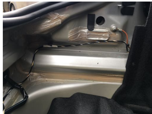
Absence de trace de réparation sur longerons avant gauche et droit