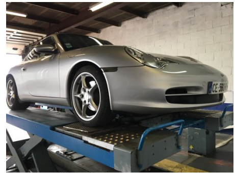
Flanc avant gauche et flanc avant droit