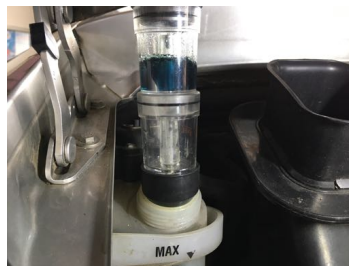
Test de CO2 dans le liquide de refroidissement