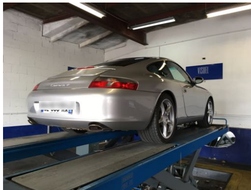
Flanc arrière droit