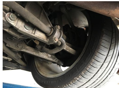
Demi-trains arrière gauche et droit