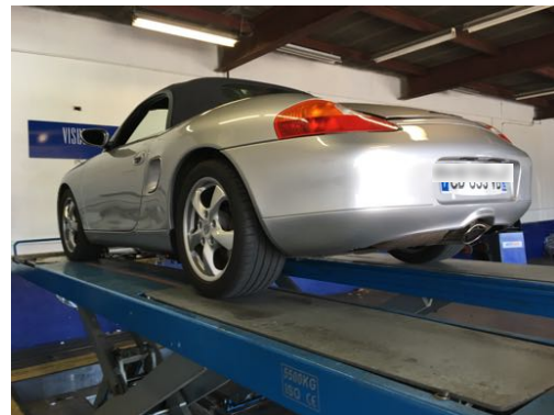
Flanc arrière droit et flanc arrière gauche