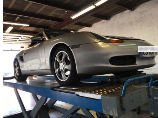
Flanc avant gauche et flanc avant droit