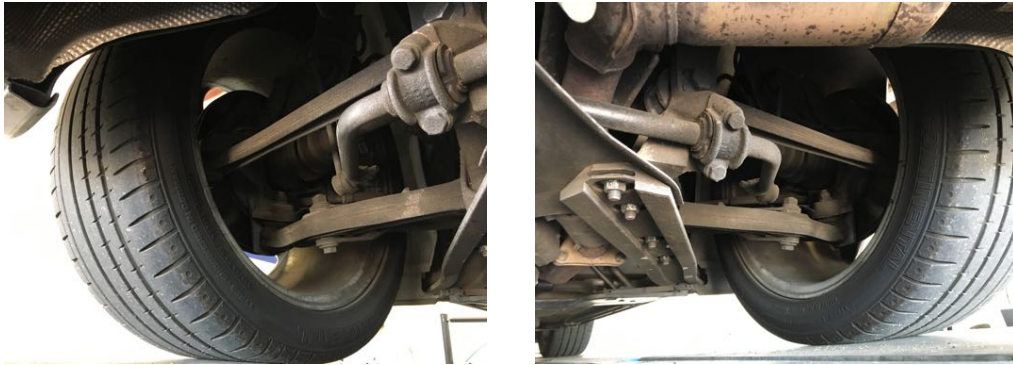
Demi-trains arrière gauche et droit