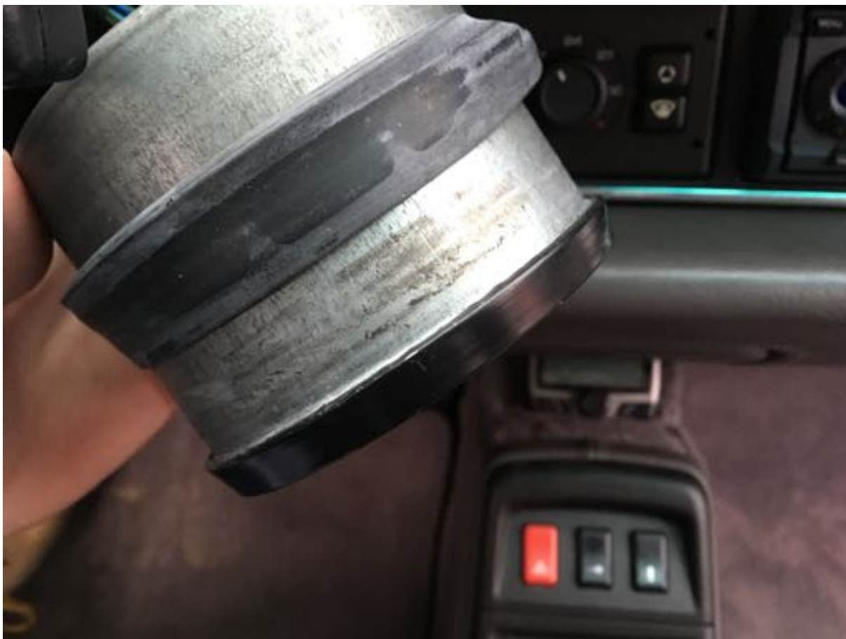
Compteur kilométrique ne présentant pas de trace de démontage / d'ouverture.