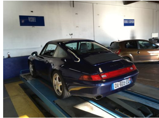
Flanc arrière droit et flanc arrière gauche