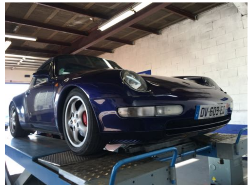
Flanc avant gauche et flanc avant droit