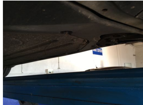
Soubassements gauches et droits