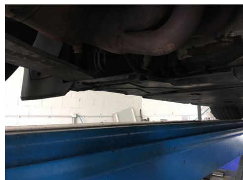
Soubassements gauches et droits