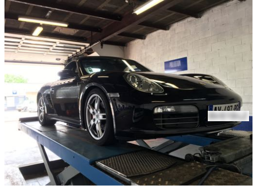
Flanc avant gauche et flanc avant droit