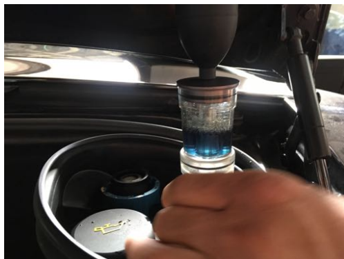
Test de CO2