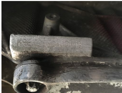
Numéro frappé sur le moteur