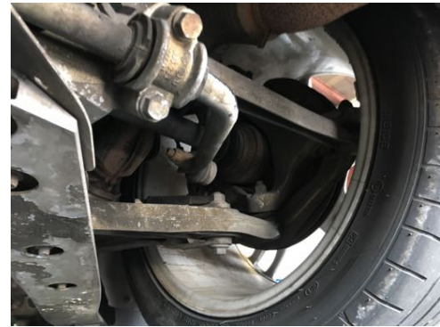
Demi-trains arrière gauche et droit