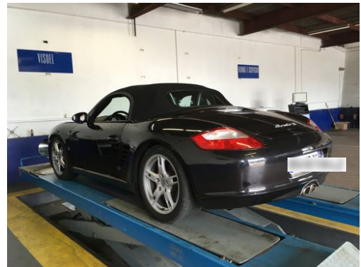
Flanc arrière droit et flanc arrière gauche