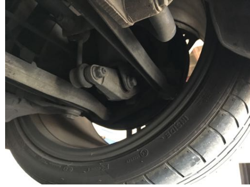
Demi-trains arrière gauche et droit