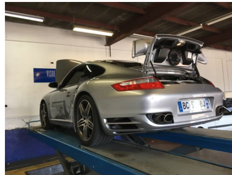
Flanc arrière droit et flanc arrière gauche