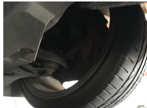
Demi-trains avant gauche et droit