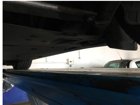
Soubassements gauches et droits