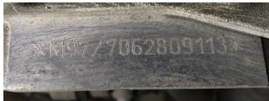
Frappe à froid numéro de moteur