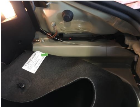
Absence de trace de réparation sur longerons avant gauche et droit