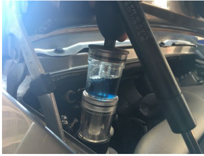
Test de CO2 dans le liquide de refroidissement