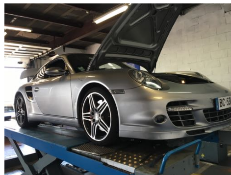
Flanc avant gauche et flanc avant droit