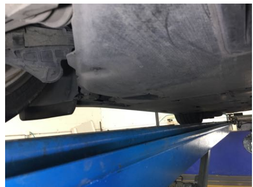
Soubassements gauches et droits