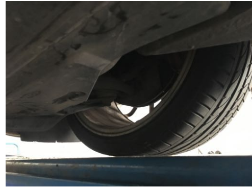
Demi-trains avant gauche et droit