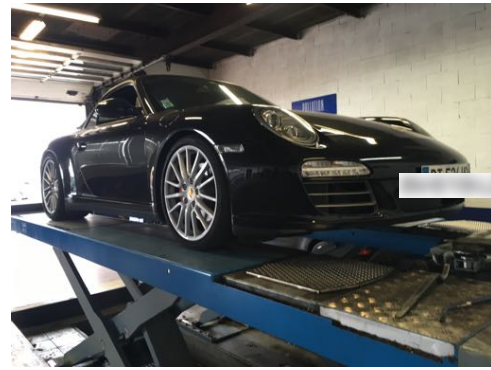
Flanc avant gauche et flanc avant droit