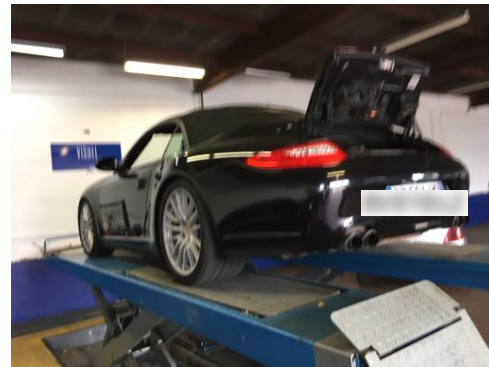
Flanc arrière droit et flanc arrière gauche