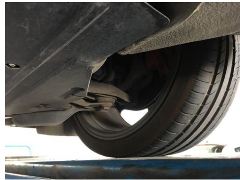
Demi-trains avant gauche et droit