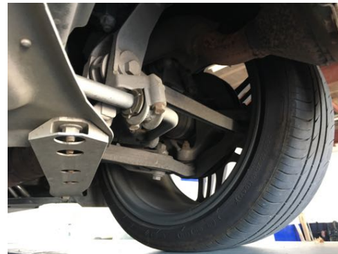
Demi-trains arrière gauche et droit