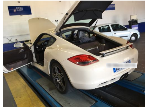
Flanc arrière droit et flanc arrière gauche