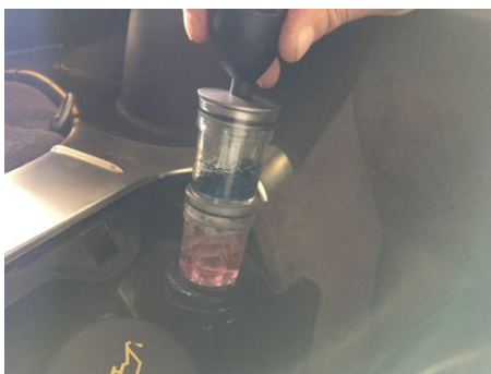
Test de CO2 dans le liquide de refroidissement