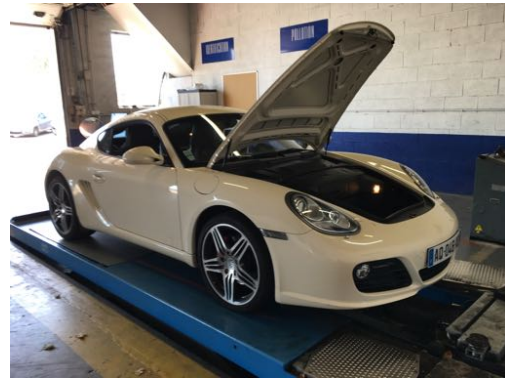
Flanc avant gauche et flanc avant droit