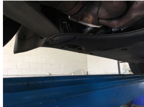
Soubassements gauches et droits