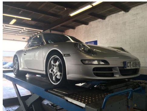
Flanc avant gauche et flanc avant droit