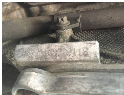
Frappe à froid numéro de moteur