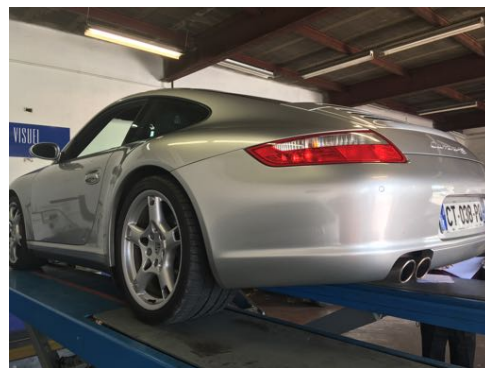
Flanc arrière droit et flanc arrière gauche