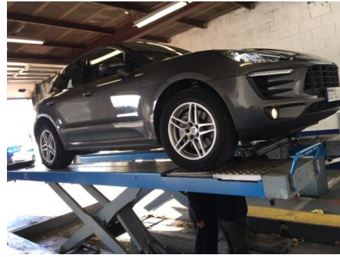
Flanc avant gauche et flanc avant droit