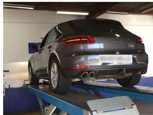
Flanc arrière droit et flanc arrière gauche