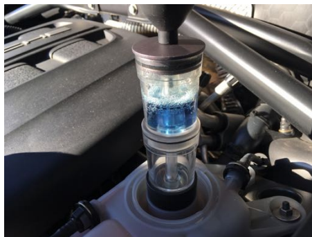
Test de CO2 dans le liquide de refroidissement