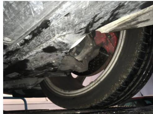
Demi-trains avant gauche et droit