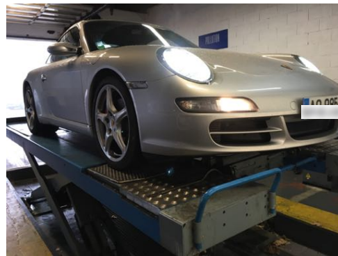
Flanc avant gauche et flanc avant droit