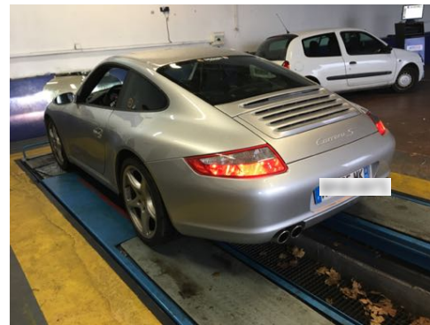
Flanc arrière droit et flanc arrière gauche