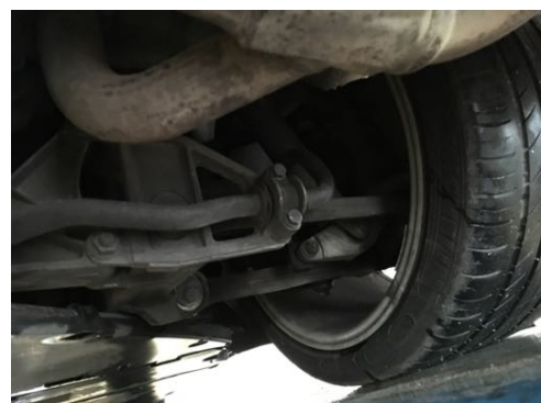
Demi-trains arrière gauche et droit