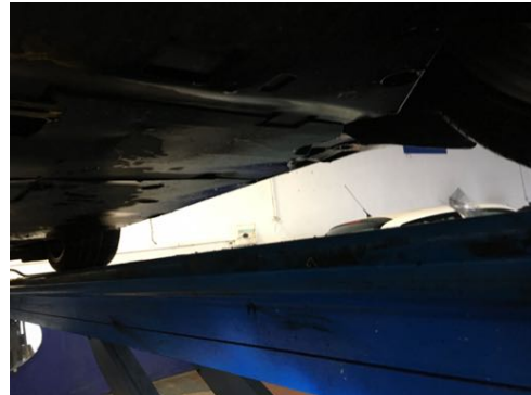
Soubassements gauches et droits