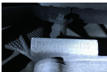
Frappe à froid numéro de moteur