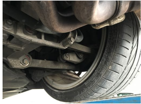
Demi-trains arrière gauche et droit