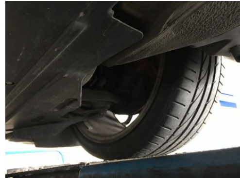
Demi-trains avant gauche et droit