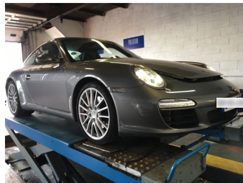
Flanc avant gauche et flanc avant droit