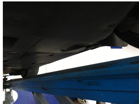
Soubassements gauches et droits