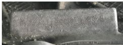
Frappe à froid numéro de moteur