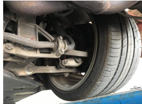
Demi-trains arrière gauche et droit