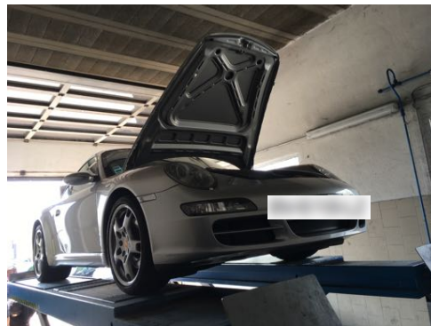
Flanc avant gauche et flanc avant droit