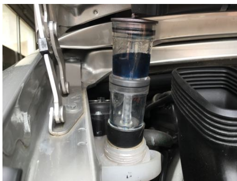
Pas de CO2 dans le liquide de refroidissement