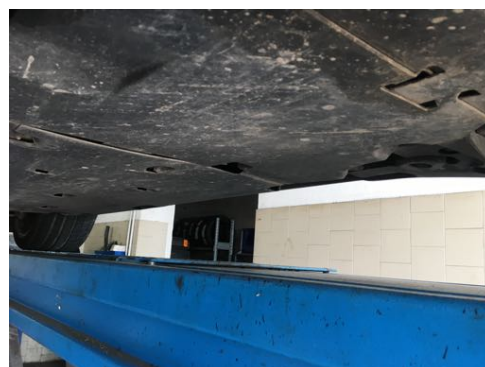
Soubassements gauches et droits