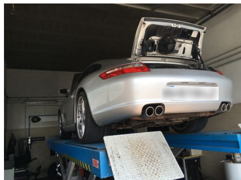
Flanc arrière droit et flanc arrière gauche