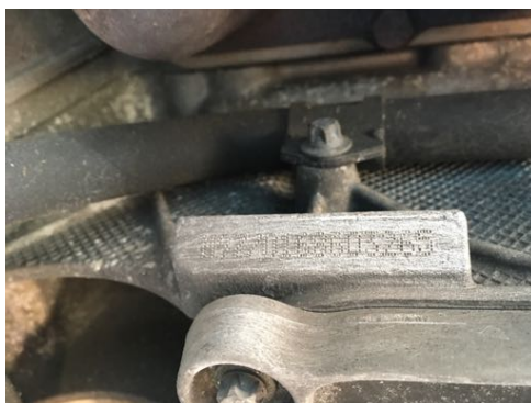
Frappe à froid numéro de moteur