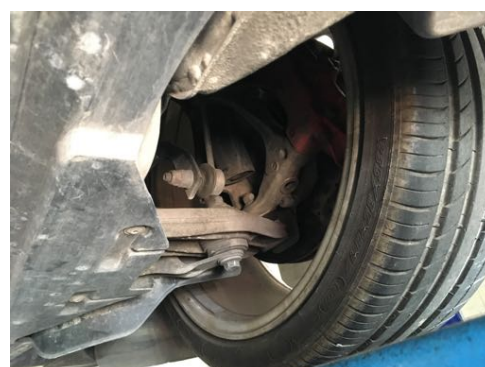
Demi-trains avant gauche et droit