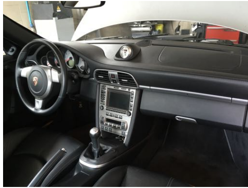
Intérieur du véhicule