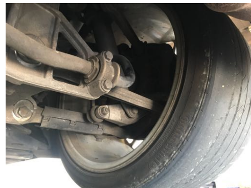
Demi-trains arrière gauche et droit