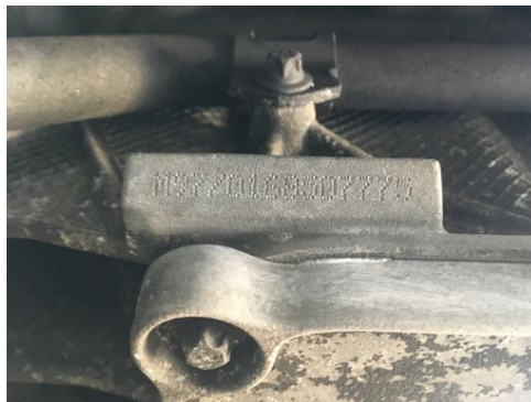
Frappe à froid numéro de moteur