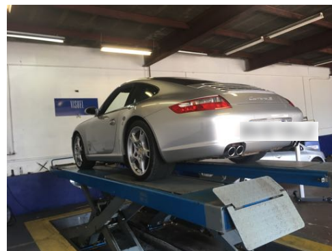
Flanc arrière droit et flanc arrière gauche