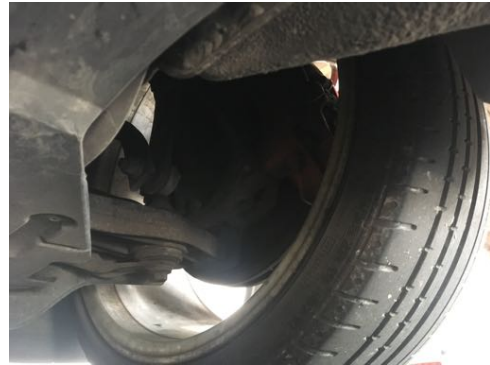
Demi-trains avant gauche et droit