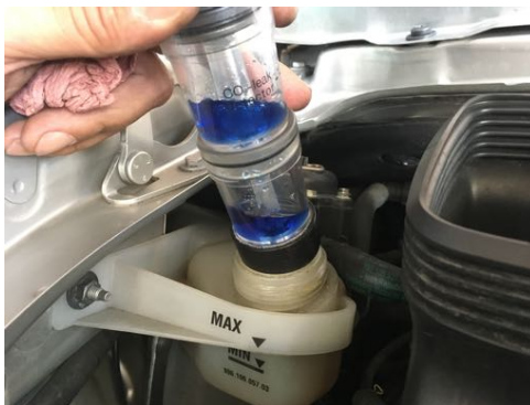
Pas de CO2 dans le liquide de refroidissement