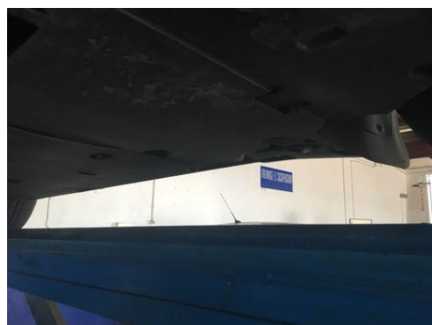
Soubassements gauches et droits