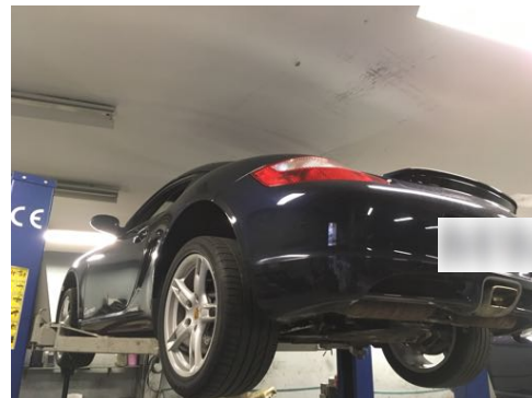
Flanc arrière droit et flanc arrière gauche