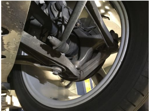
Demi-trains arrière gauche et droit