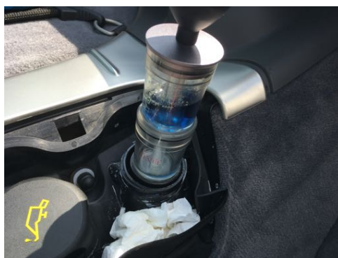
Test de CO 2 dans le liquide de refroidissement