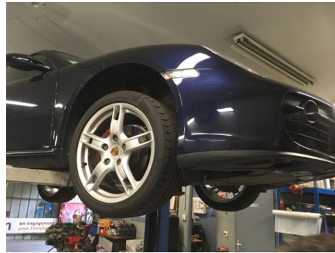
Flanc avant gauche et flanc avant droit