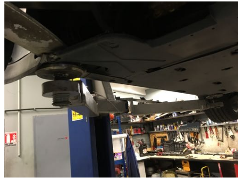
Soubassement gauche et droit