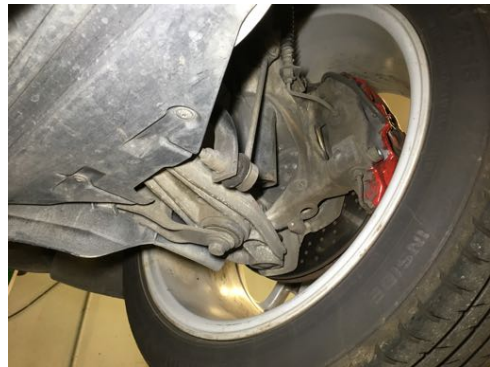
Demi-trains avant gauche et droit