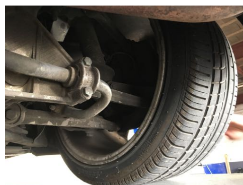
Demi-trains arrière gauche et droit