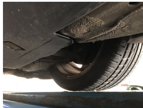
Demi-trains avant gauche et droit