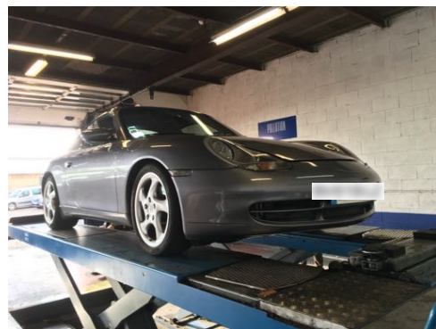
Flanc avant gauche et flanc avant droit