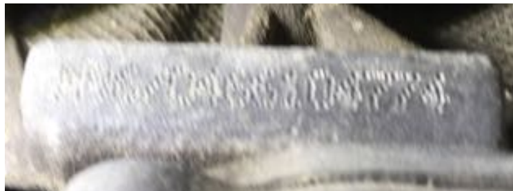
Frappe à froid numéro de moteur