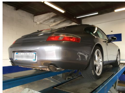
Flanc arrière droit et flanc arrière gauche