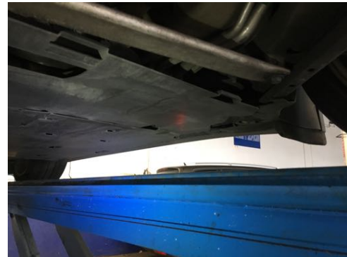
Soubassements gauches et droits