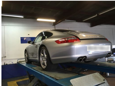
Flanc arrière gauche