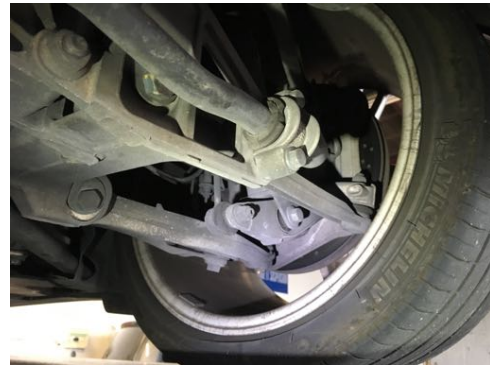
Demi-trains arrière gauche et droit