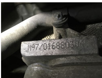
Frappe à froid numéro de moteur