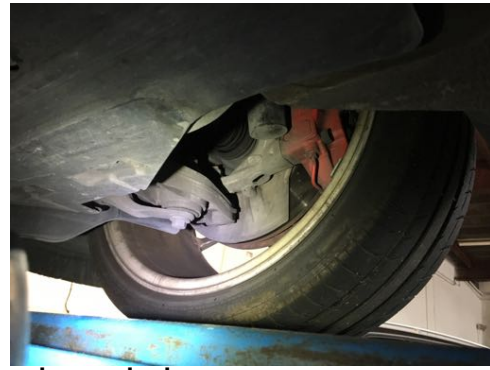
Demi-trains avant gauche et droit