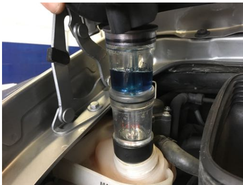
Absence de CO2 dans le liquide de refroidissement