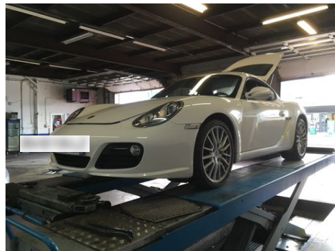
Flanc avant gauche et flanc avant droit