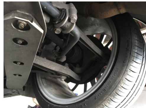
Demi-trains arrière gauche et droit