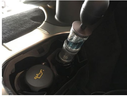
Absence de CO2 dans le liquide de refroidissement