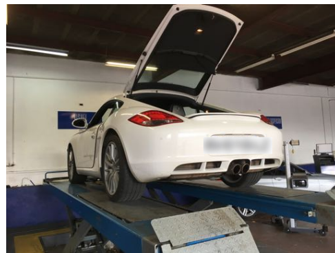
Flanc arrière droit et flanc arrière gauche