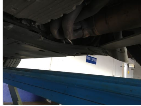
Soubassement gauche et droit