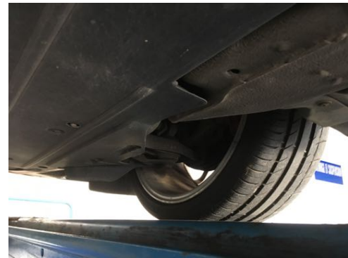
Demi-trains avant gauche et droit