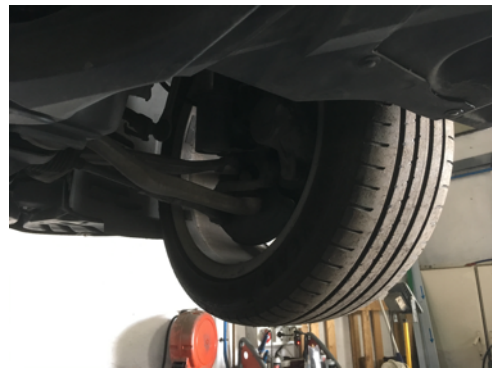
Demi-trains avant gauche et droit