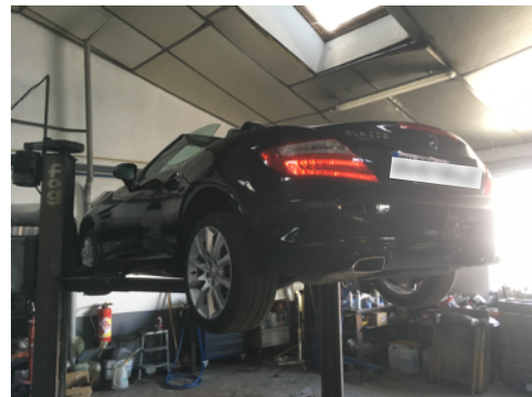
Flanc arrière droit et flanc arrière gauche