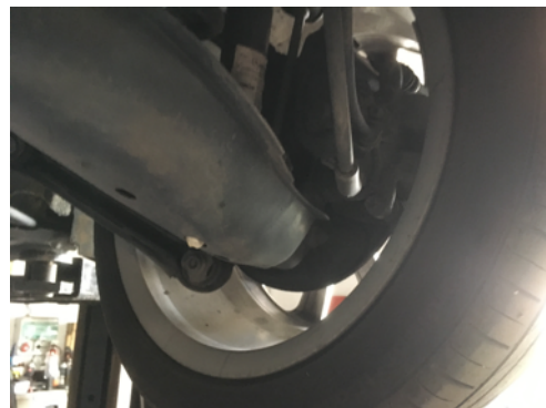
Demi-trains arrière gauche et droit