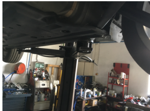
Soubassements gauches et droit