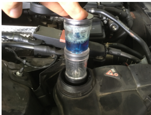
Absence de trace de CO2 dans le liquide de refroidissement