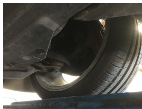
Demi-trains avant gauche et droit