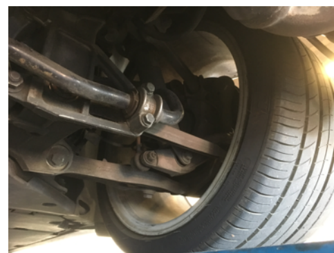
Demi-trains arrière gauche et droit