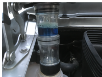
Absence de CO2 dans le liquide de refroidissement