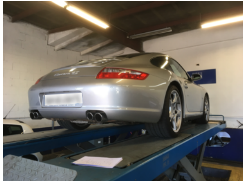
Flanc arrière gauche et flanc arrière droit