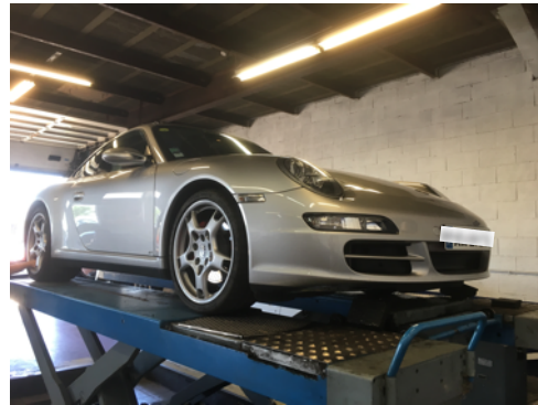
Flanc avant gauche et flanc avant droit