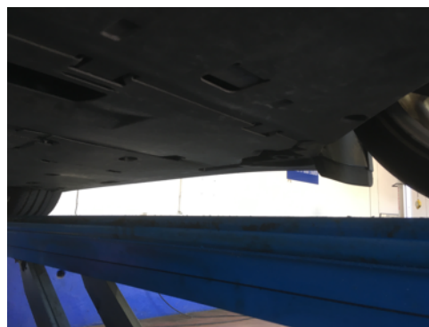
Soubassements gauches et droits