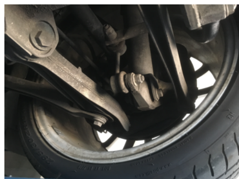
Demi-trains arrière gauche et droit