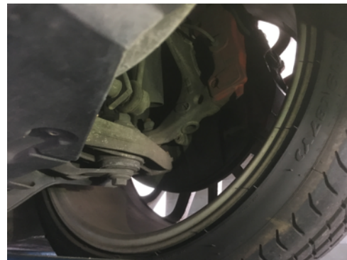
Demi-trains avant gauche et droit