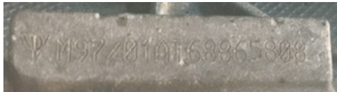
Frappe à froid numéro de moteur