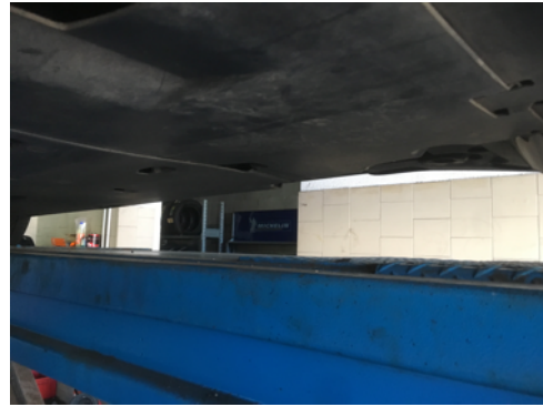
Soubassements gauches et droits