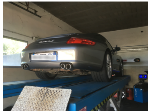
Flanc arrière gauche et flanc arrière droit