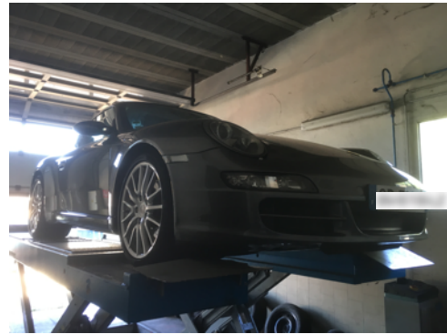
Flanc avant gauche et flanc avant droit