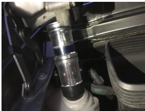
Absence de CO2 dans le liquide de refroidissement