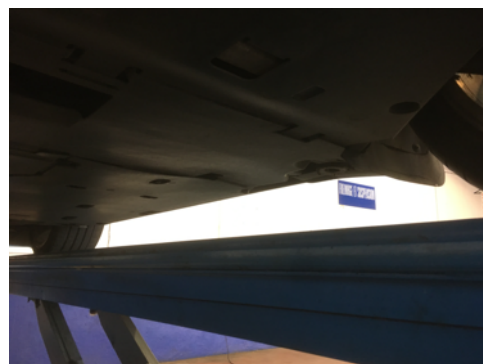
Soubassements gauches et droits