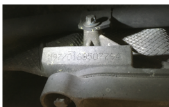
Frappe à froid numéro de moteur