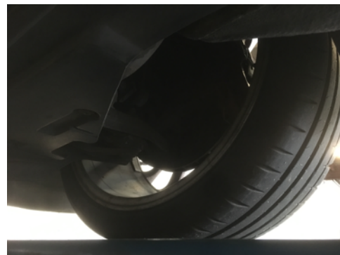
Demi-trains avant gauche et droit