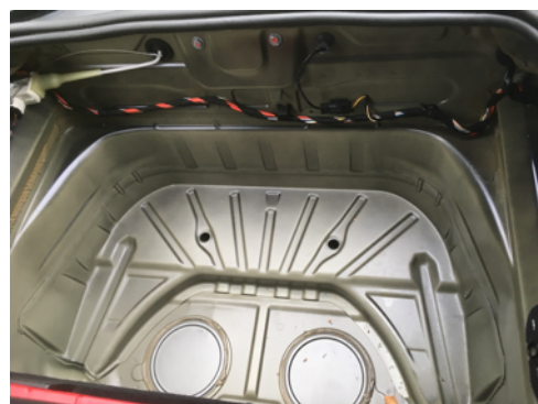
Absence de trace de réparation sur longerons avant gauche et droit