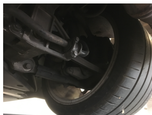
Demi-trains arrière gauche et droit