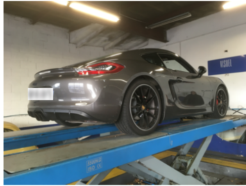
Flanc arrière gauche et flanc arrière droit