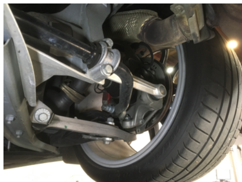
Demi-trains arrière gauche et droit