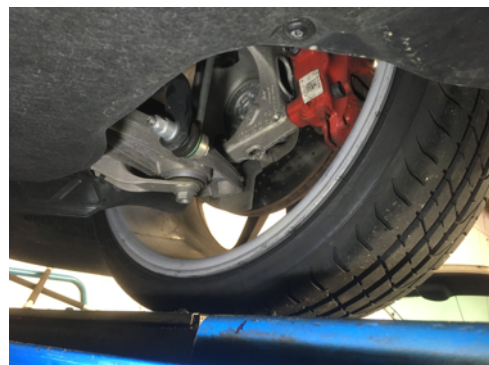
Demi-trains avant gauche et droit