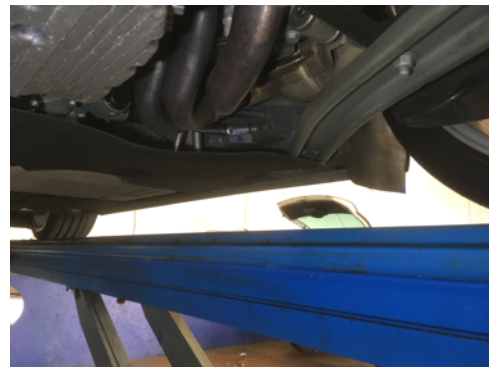
Soubassements gauches et droits