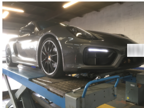
Flanc avant gauche avant droit