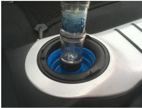
Absence de CO2 dans le liquide de refroidissement