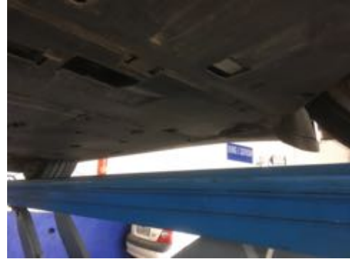
Soubassements gauche et droit