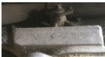
Frappe à froid numéro de moteur