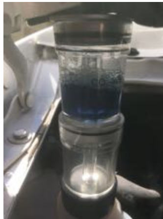
Absence de CO2 dans le liquide de refroidissement