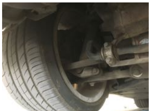
Demi-trains arrière gauche et droit