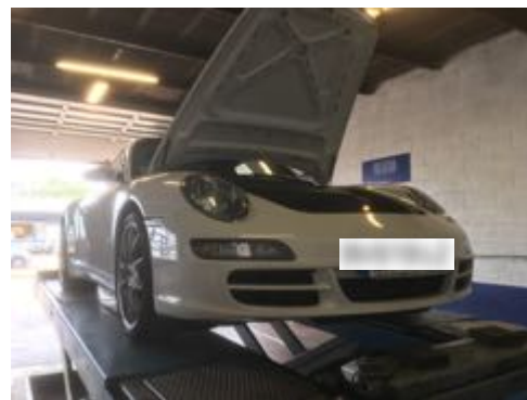
Flanc avant gauche et flanc avant droit