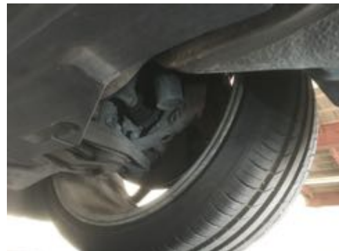
Demi-trains avant gauche et droit