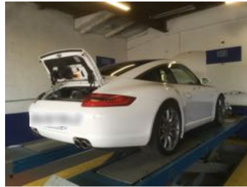
Flanc arrière gauche et flanc arrière droit