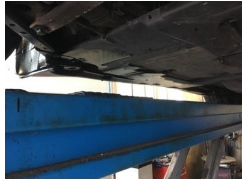
Soubassement gauche et droit