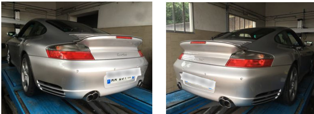
Flanc arrière gauche et flanc arrière droit