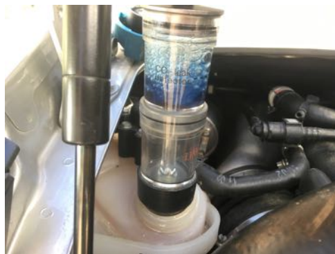
Absence de CO2 dans le liquide de refroidissement