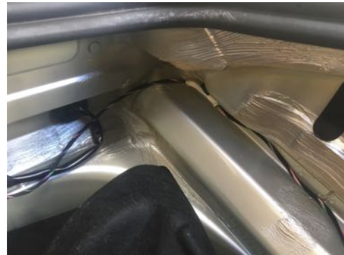
Absence de trace de réparation sur longerons avant gauche et droit