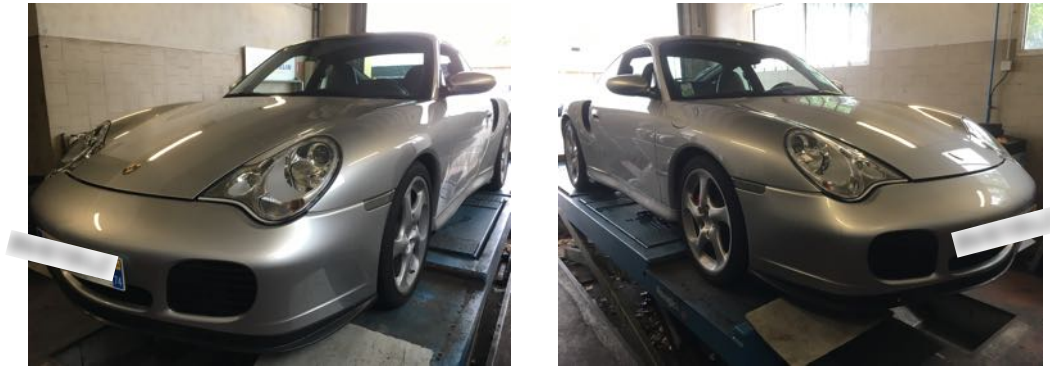
Flanc avant gauche et flanc avant droit