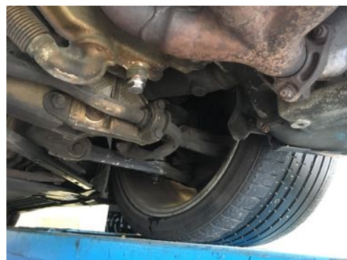
Demi-trains avant gauche et droit